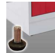
Socle hauteur 100 mm + vérins