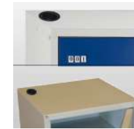
Kit de branchement pour VMC