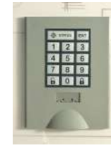
Pour milieu sec Serrure électronique à code variable 4 chiffres + code maître

Une SOLUTION pour chaque type de GESTION !