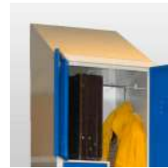
Coiffe / toit incliné propreté