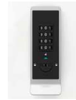
Code fixe ou libre