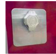
Plaque de propreté inoxydable