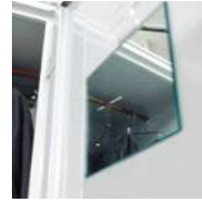
Miroir interne de courtoisie