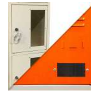
Regard de sécurité plexiglas