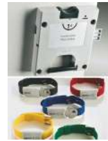
Serrure à clé prisonnière avec pièce de monnaie restituée ou encaissée + bracelet