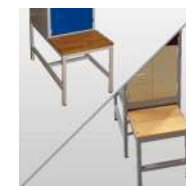
Socle banc fixe ou retractable

Nos disposons 4 déclinaisons possibles en simple ou double dos à dos