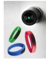
Serrure transpondeur + bracelet

pastilles transparentes en caoutchouc pour réduire le bruit lors de la fermeture de la porte.