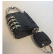
Cadenas à code 4 molettes (option pass général)