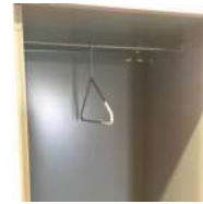
Cintre métallique fixe