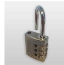
Cadenas à code 3 molettes