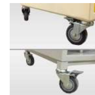
Roulettes avec ou sans frein