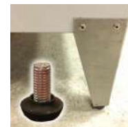
Pieds inoxydables + vérins de