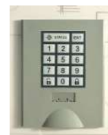
Pour milieu sec Serrure électronique à code variable 4 chiffres + code maître

Une SOLUTION pour chaque type de GESTION !