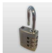
Cadenas à code 3 molettes