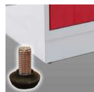
Socle hauteur 100 mm + vérins