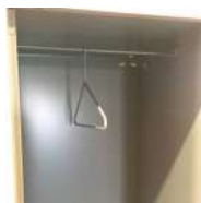
Cintre métallique fixe