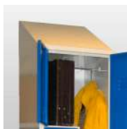
Coiffe / toit incliné propreté