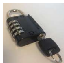
Cadenas à code 4 molettes (option pass général)