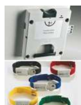
Serrure à clé prisonnière avec pièce de monnaie restituée ou encaissée + bracelet