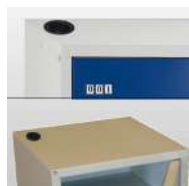
Kit de branchement pour VMC