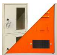
Regard de sécurité plexiglas