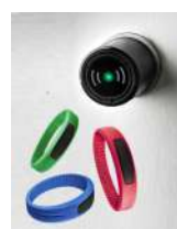
Serrure transpondeur + bracelet