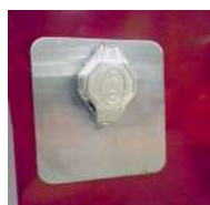
Plaque de propreté inoxydable