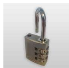
Cadenas à code 3 molettes