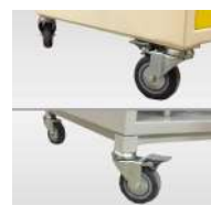
Roulettes avec ou sans frein