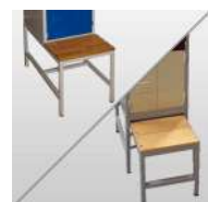
Socle banc fixe ou retractable

OPTIONS DISPONIBLES SUR TOUS NOS VESTIAIRES En PLUS VALUE !