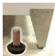
Pieds inoxydables + vérins de