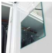
Miroir interne de courtoisie