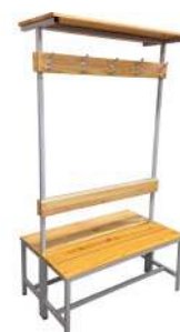
Nos disposons 4 déclinaisons possibles en simple ou double dos à dos