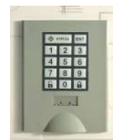
Pour milieu sec Serrure électronique à code variable 4 chiffres + code maître

Une SOLUTION pour chaque type de GESTION !