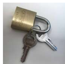
Cadenas à clé

Une SOLUTION pour chaque type de GESTION !