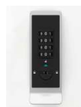
Code fixe ou libre