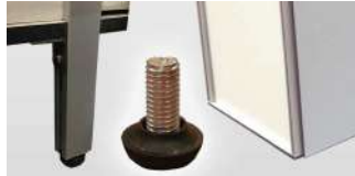
Avec pieds + vérins de réglage (HT : 1960 mm) OU Sans pieds + vérins de réglage (HT : 1820mm)