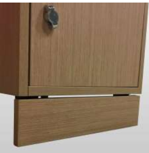
Plinthes cache hauteur 100mm + vérins