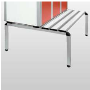
Socle banc fixe