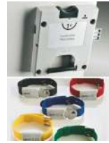
Serrure à clé prisonnière avec pièce de monnaie restituée ou encaissée + bracelet