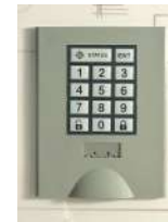
Pour milieu sec Serrure électronique à code variable 4 chiffres + code maître

Une SOLUTION pour chaque type de GESTION !