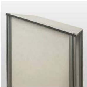
Coiffe / toit incliné propreté