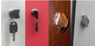
à clés (2 clés fournis) OU à cadenas (cadenas non fournis)